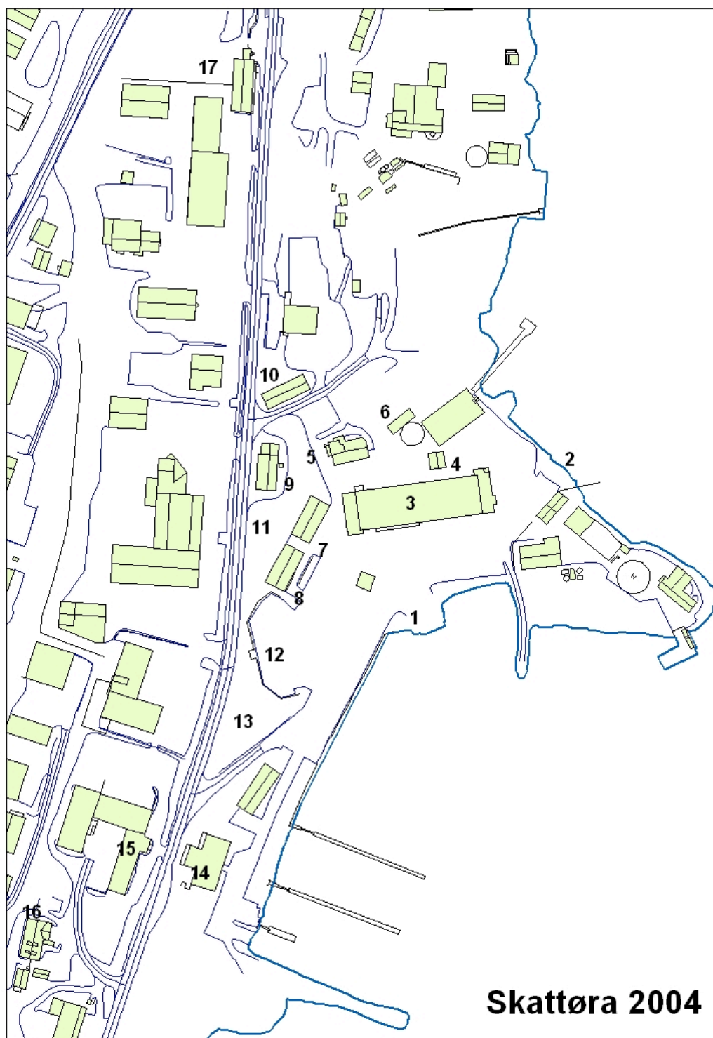
Figur: Skattøra med følgende strukturer avmerket: 1) søndre opptrekk, 2) nordre opptrekk, 3) Hangar, 4) Rester etter hangarutbygg, 5) grunnmur fra torpedolager, 6) bunker, 7) verkstedsbrakke, 8) verkstedsbrakke, 9) "jernbanebrakka", 10) velferdslokale, 11) bombekrater, 12) splintmur, 13) grunnmur etter vaktbrakke, 14) overbygget splintmur, 15) messe, 16) sykestue, 17) lagerbygg. Kartgrunnlag fra VG-innsyn, Tromsø kommune.

NB. Utfyllinga i sjøen gjort av marinaselskapet er ikke avmerka på kartet her.